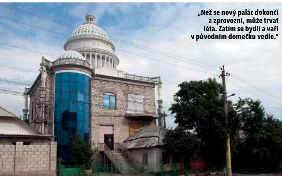
„Než se nový palác dokončí a zprovozní, může trvat léta. Zatím se bydlí a vaří v původním domečku vedle.“

Ta se má vdát z domu. Tak „velí tradice“. Kluk převezme jablečný byznys. Barák je obrovské, ale všichni vlastně bydlí prakticky v jedné místnosti, ve které v zimě topí jediná kamna v domě. Sourozenci-studenti mají sice dohromady svůj „dětský pokoj“, kde ale není pořádný pracovní stůl a v zimě se tam netopí. A už jim fakt dost leze na nervy, že spí pořád spolu. „Brácha, já kvůli tobě snad zůstanu panna!“ směje se ona. Ten nedostatek soukromí, o kterém jsem se bavi-