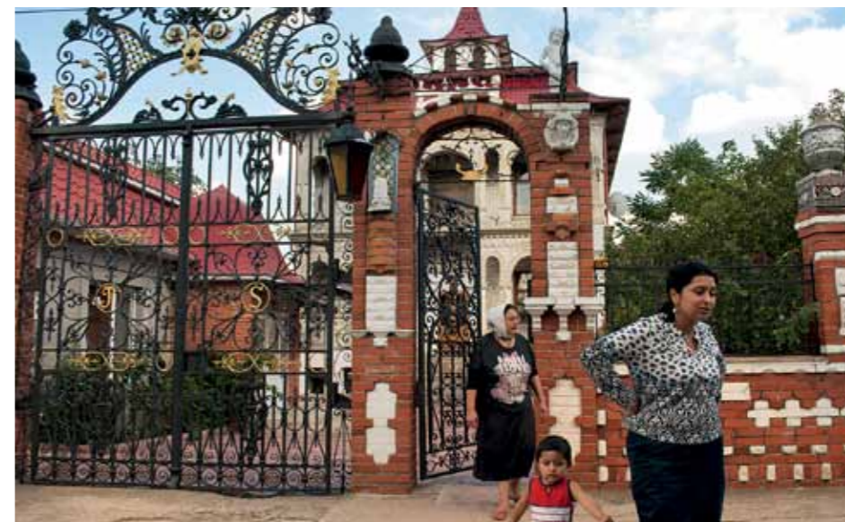
„Zprvu jsem trochu lupal po dechu, ale postupně se mi to začalo líbit. Testuji tu estetiku na sobě, když v těch domech bydlím.“