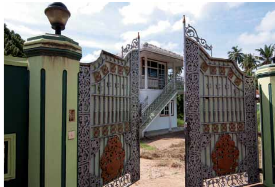
▲ „Mnohé domy vznikající na Srí Lance napodobují paláce starých maharadžů i novější koloniální art deco vily.“

Jsou to trochu závody ve zbrojení, každý chce mít svůj dům co největší, tak je ženou výš a výš. Nebývá tam kanalizace, splašky tečou mezi domy. Dlážděné cesty tam nejsou, nebo jen dlažba položená na hlínu, kterou vymele první větší dešť. Nebo stojí v místech, kde pro tolik staveb není prostor. Třeba tady na obrázku vidíme původně malou horskou vísku na pomezí Kosova-Makedonie-Albánie v nadmořské výšce jako na Sněžce.