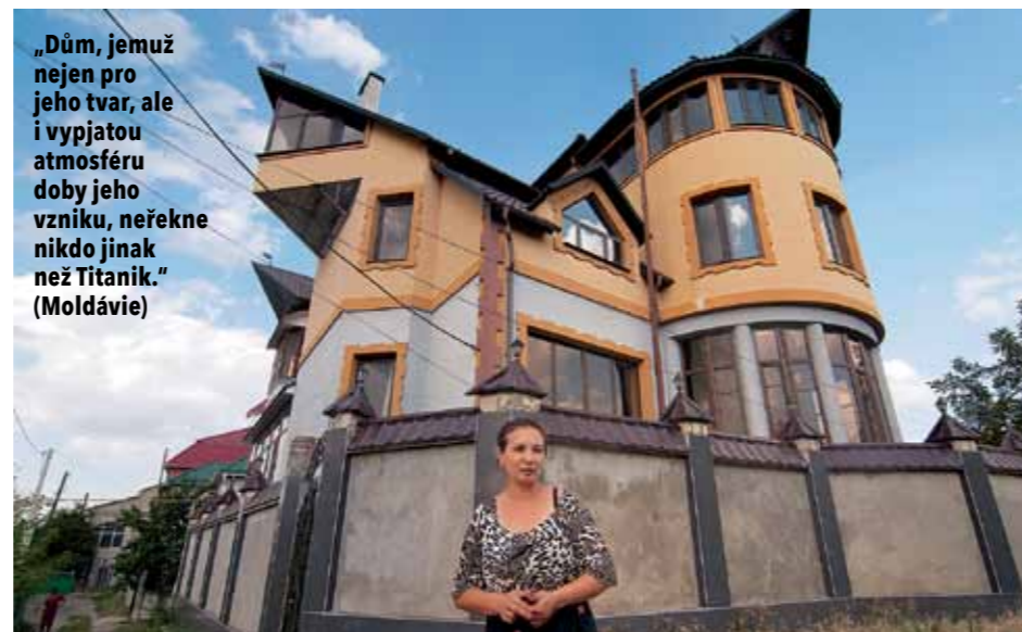
„Dům, jemuž nejen pro jeho tvar, ale i vypjatou atmosféru doby jeho vzniku, neřekne nikdo jinak než Titanik.“ (Moldávie)