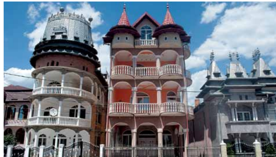
▲ „Rumunským kočovným Romům-Kalderašům se po vstupu země do EU otevřel velký svět a s ním i velké bohatství, velké svody a očekávání.“

Ano, často jde o celé nové venkovské a předměstské krajiny, většinou urbanisticky nesmyslně řešené. Baráky si vzájemně zavazí a stíní, což zažehává konflikty.