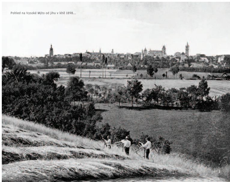
Pohled na Vysoké Mýto od jihu v létě 1898...

Příkladkem budíž klima. Jeho aktuální změny sice mají svou obdobu v relativně nedávné minulosti, jenže v té době bylo na Zemi o několik řádů méně lidí a krajina vypadal jinak. Jak ukázaly výzkumy archeologů včetně našich egyptologů, i tak přispěly minulé klimatické změny ke kolapsům civilizací. Většina organismů se s nimi ovšem dokázala vyrovnat