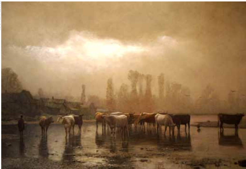
Potřebují hodně fosforu – stejně jako lidé.