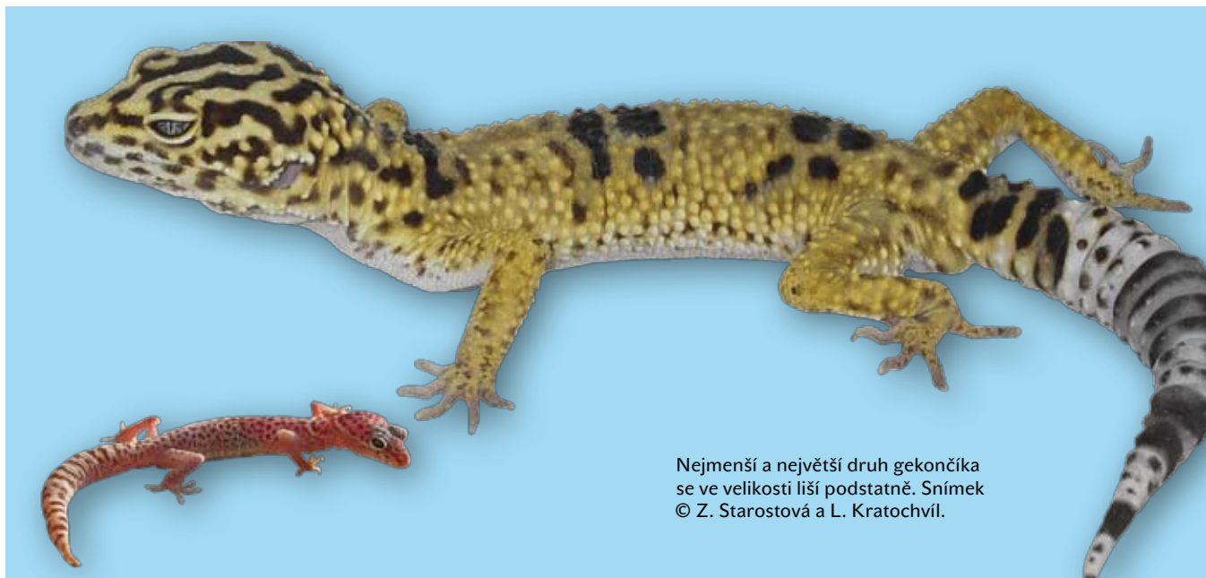
Nejmenší a největší druh gekončíka se ve velikosti liší podstatně.